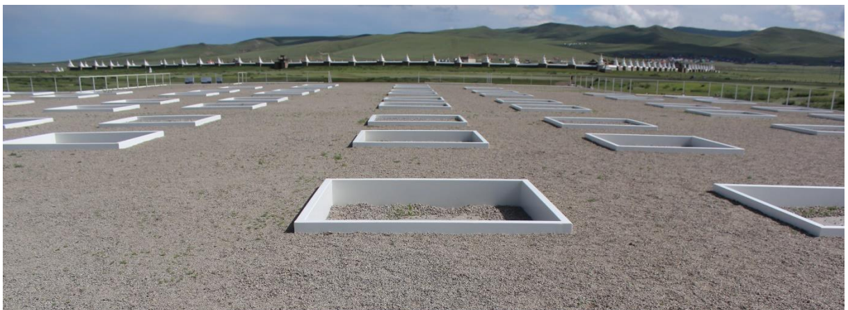
Цогт их асар сүмийн баганы суурь

Төрөл бүрийн органик үлдэгдлүүдэд хийсэн C_{14} -ийн шинжилгээ ба термолюминесценцийн судалгааны үр дүнд гарсан байгалийн шинжлэх ухааны он цаг ихэнхдээ XIII-XIV зуун гэж гарсан нь цаг хугацааны хувьд түүхийн сурвалж бичгүүдэд тэмдэглэсэн он цагтай яв цав нийцэж байжээ. Ийнхүү түүх, археологийн харьцуулсан судалгаагаар Хархорумын “Их танхим” нь үүрэг зориулалт ба ашиглалтын хувьд бүхэлдээ буддын сүм байсан нь тодорхой нотлогдохын зэрэгцээ хамгийн сүүлд явуулсан малтлагаар уг барилга 1346 оны Хархорумын бичээст дурдсан “Юань улсыг мандуулах асар” мөн болохыг улам баталж өгсөн байна.